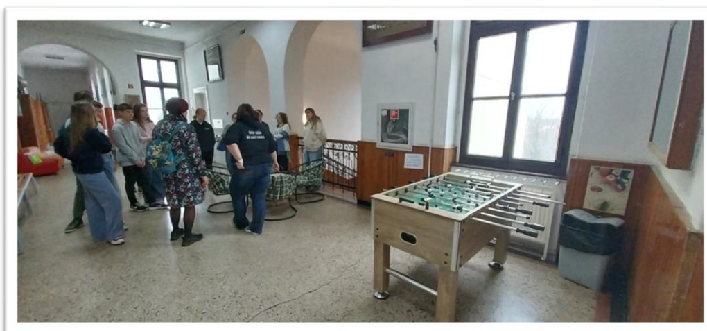
Látóút a BEG-ben

A kezdeti szakaszban azt tapasztaltuk, hogy a diákok olykor bátortalanok voltak: nehezen képzeltek el, hogy valódi döntési jogot kaphatnak az iskola komfortosabbá tételében. Az inspiráció és a jó gyakorlatok megismerése érdekében márciusban látóutat szerveztünk a Szeberényi Gusztáv Adolf Evangélikus Gimnáziumba. Itt a tanulók betekintést nyertek a középiskolás diáktársak által már kialakított „chill sarkok” és közösségi terek világába, ami nagyban segítette saját ötleteik megfogalmazását.