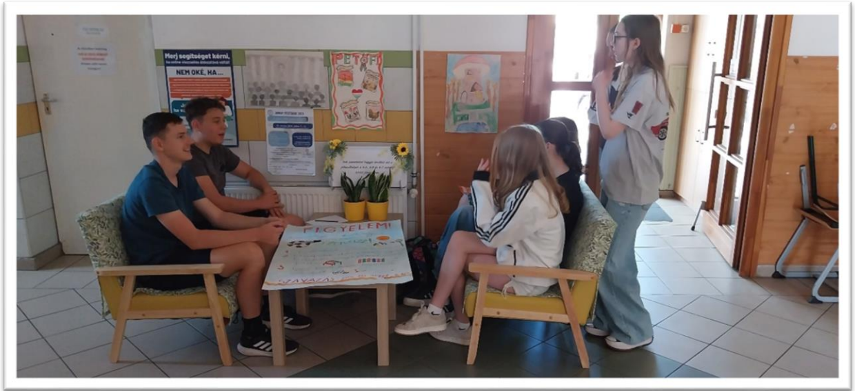
Pihenősarok - a ballagók ajándéka az iskola kollektívája számára

Bár a pihenősarkok kialakítását eredetileg nem támogatta a vezetés, a projekt hatására a ballagó osztályok és szüleik végül egy pihenősarokkal ajándékozták meg az intézményt, bizonyítva a közösségi kezdeményezés erejét.