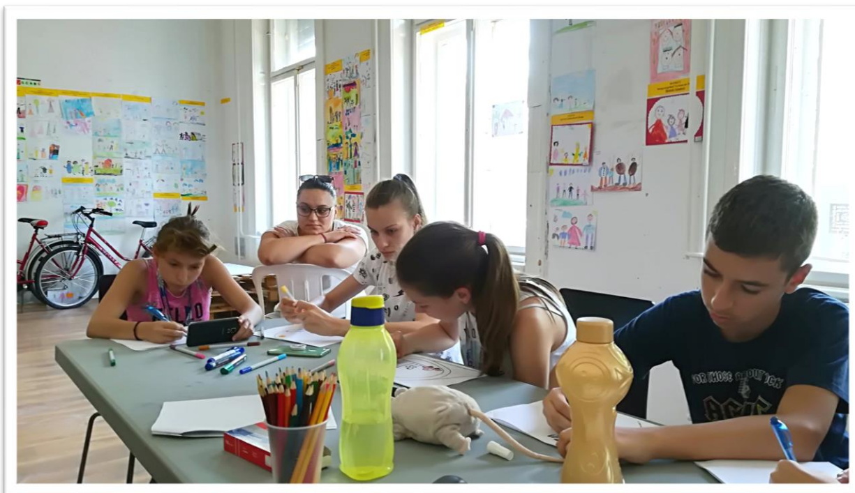
Andrássy Úti Társaskör - Pályaorientációs tábor, projektmunka