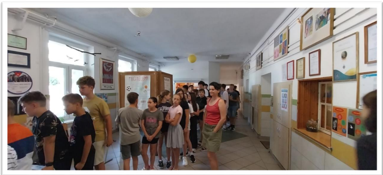
A végláthatatlan sor a szavazókörben