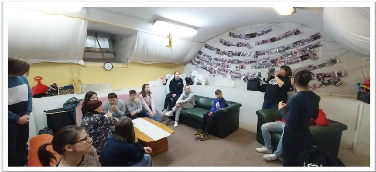
Látóúton a BEG-ben - klubszoba