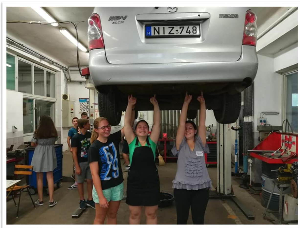
Pályorientációs tábor - látogatás a Keményben

A „KONTAKTBAN, közösen, közösségben” projekt keretében alapítványunk vállalta a Jankay Tibor Két Tanítási Nyelvű Általános Iskolában zajló közösségi költségvetési folyamat szakmai mentorálását és koordinációját. Ennek során nemcsak a technikai lebonyolítást segítettük, hanem a diákok és pedagógusok közötti párbeszédet is facilitáltuk.